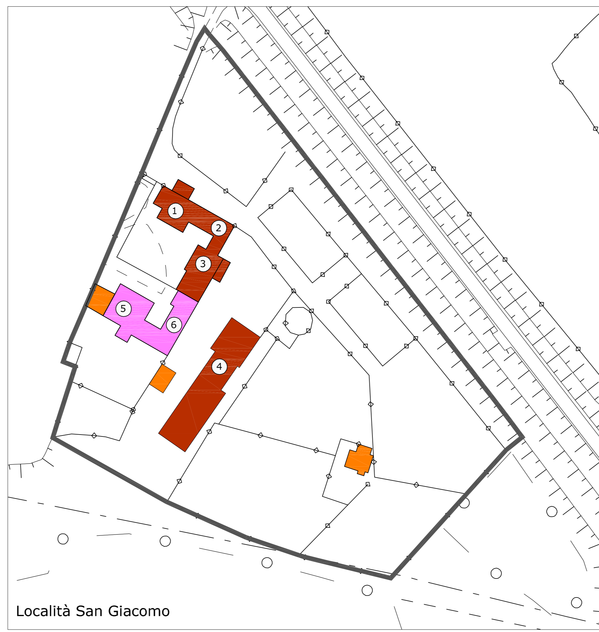
Località San Giacomo