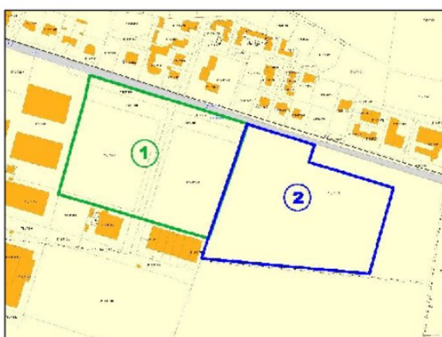
C.T. FOGLIO 12